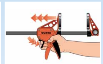
Մեկ ձեռքով բացում

Համապատասխան սեղմակներով՝ կիրառման ենթակա դետալների և սեղանի վրա հարմար ամրանալու համար