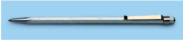
Կարծր համաձուլվածքի գծիչ Արտիկուլ 0714 70 05 Փ./հատ 1