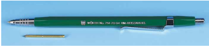
Արտիկուլ 0714 70 04 Երկարությունը՝ 150 մմ Փ./հատ 1