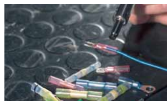
Միակցիչներ գոդման/կծկման համար