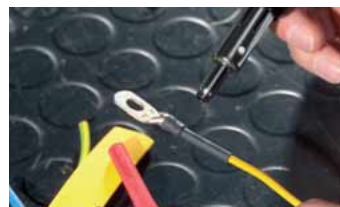
Նրբապատ, ջերմությունից կծկվող ճկափողեր

Տաք օդի ծայրոցն սպահովում է բաց կրակի բացակայություն. ֆասավելու հավանականությունը չնչին է