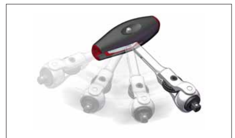
Կարող է կիրառվել որպես T-աձև բռնակով կամ ճչանակով: Կարող է անհանվել ցանկացած անկյան տակ: Կարող է կողպվել կրկնակի օղակով