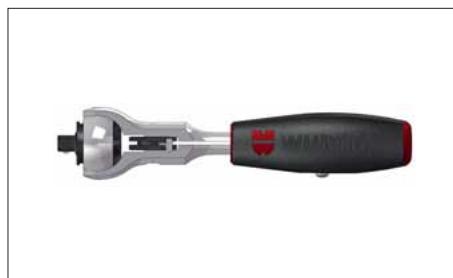
Կարող է կիրառվել որպես պտուտակահան