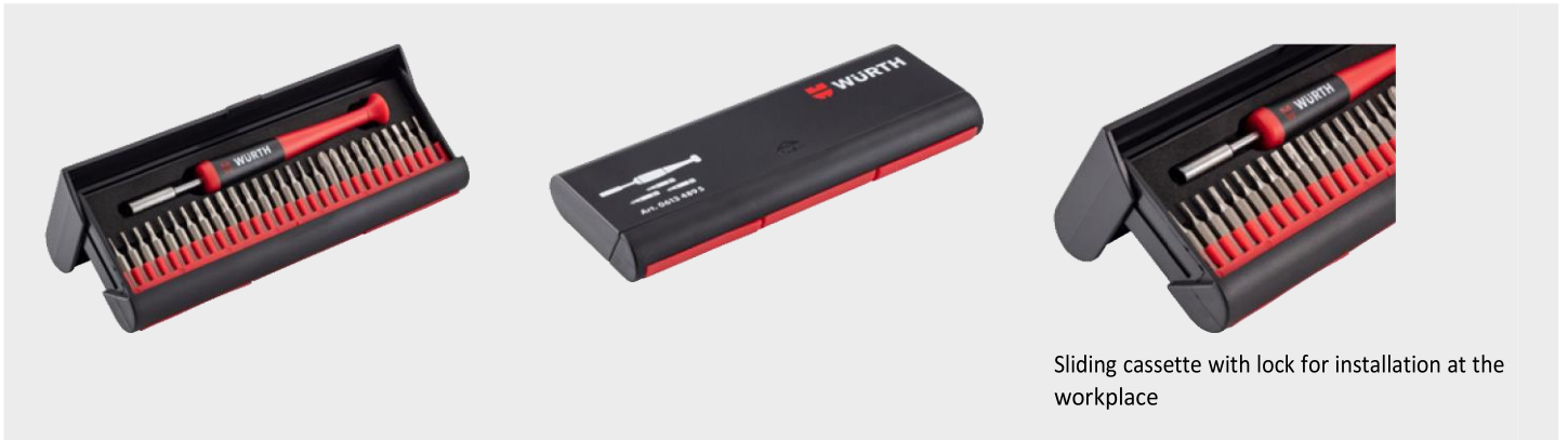
Sliding cassette with lock for installation at the workplace

CI01_6013040205, Rev:0.279, State:26.11.2021